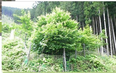
H23 (春) 4 年後の姿