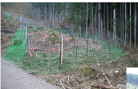
H19 (秋) 植樹直後